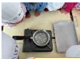
グラニュー糖が溶けて いく様子に興味津々

もうすぐ1年生🍯おうちでもいろいろなお手伝いに挑戦してほしいと思います(*'ω')