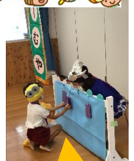
どれにしようかな