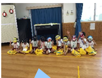
おめんをかぶって ハイポーズ