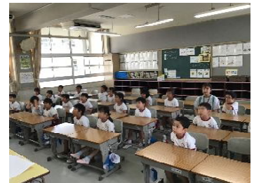
1年生の教室 模擬授業を体験