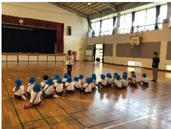
体育館 とっても広かったよ