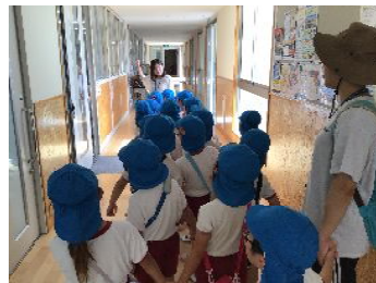
職員室・保健室・図書室など いろいろな教室を見学