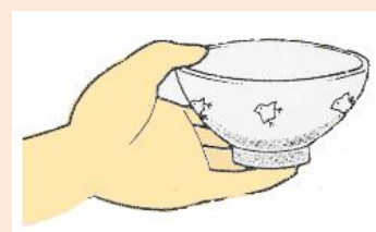
茶碗やお皿は手に持つ