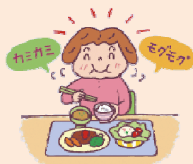
ごはんとおかずは交互によくかんで